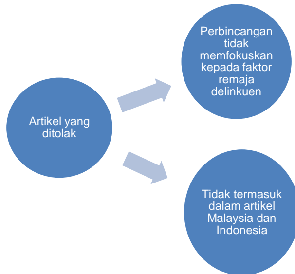
Rajah 2: Justifikasi artikel yang ditolak