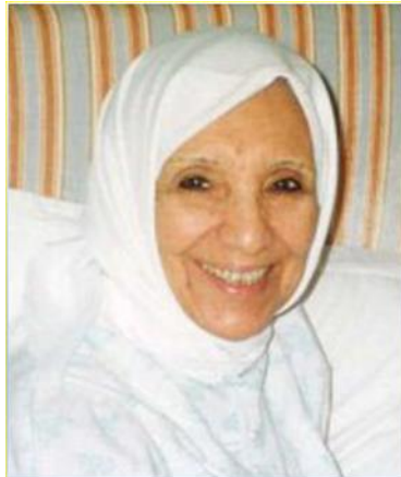
Gambar A: Ratu Sayyidah Fatimah al-Shifa binti Ahmad al-Sharif al-Sanusi (1911-2009)