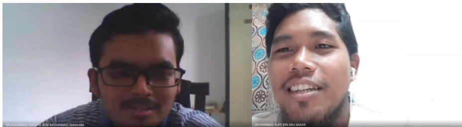
Rajah 1. Perkembangan teknologi dalam pengajaran dapat meningkatkan sikap mahasiswa terhadap pembelajaran di dalam kuliah dan di luar bilik kuliah.